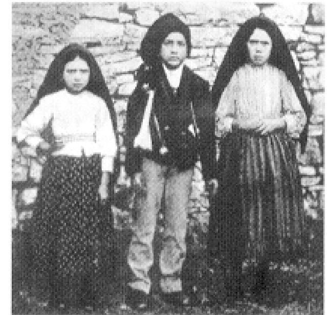
Die Hirtenkinder von Fatima

Zwei Fragen zu einem umstrittenen Phänomen